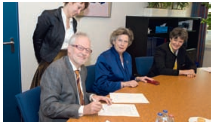
Vervolg op pagina 2